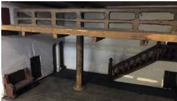
Het stadhuis uitgepakt