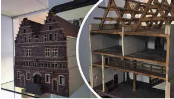
Een bijzondere vondst