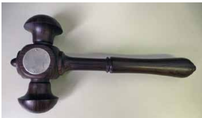
Voorzittershamer van het voormalige Groene Kruis, aangeboden aan het bestuur door de Gemeente Arnhem i.v.m. het zestigjarig bestaan van het Groene Kruis. Collectie Museum Arnhem.