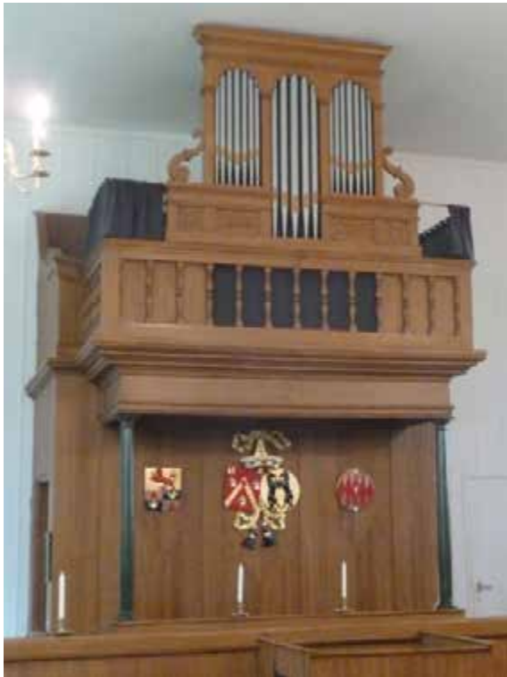
Orgel met herenbank kerk Kleverskerke