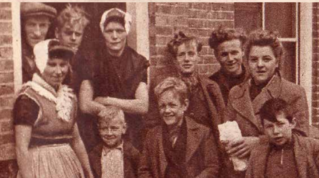
Arnhemuiden in oorlogstijd.